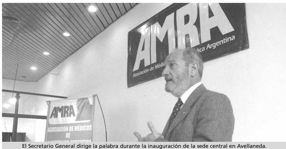
El Secretario General dirige la palabra durante la inauguración de la sede central en Avellaneda.

cato ante los poderes Ejecutivo y Legislativo.