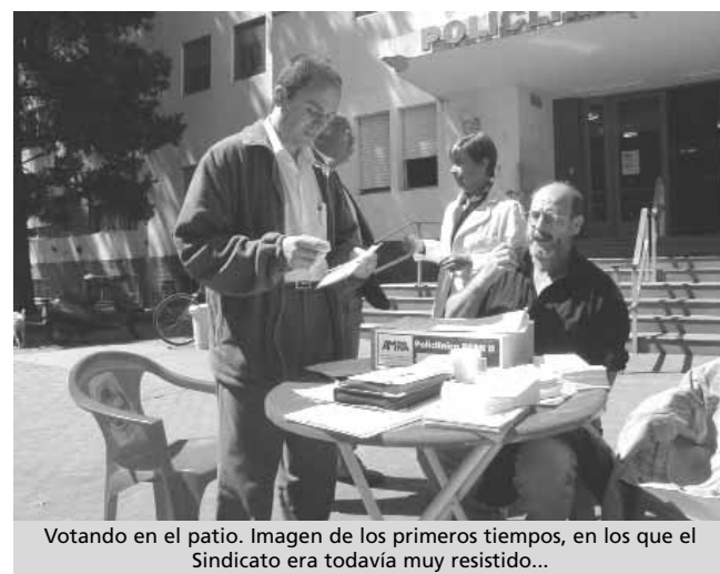
Votando en el patio. Imagen de los primeros tiempos, en los que el Sindicato era todavía muy resistido...

En esta jurisdicción logramos en el año 2003 suspender el reconcurso anual de los médicos de guardia municipales, concursándose a partir de allí solamente las vacantes reales.