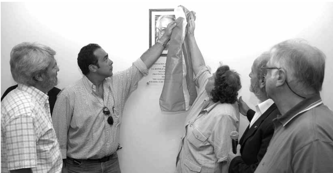
Inauguración de la nueva sede propia de la Seccional Santa Fe, en Rosario.

Este objetivo se logró con la intervención, por primera vez, de nuestro Sindi-