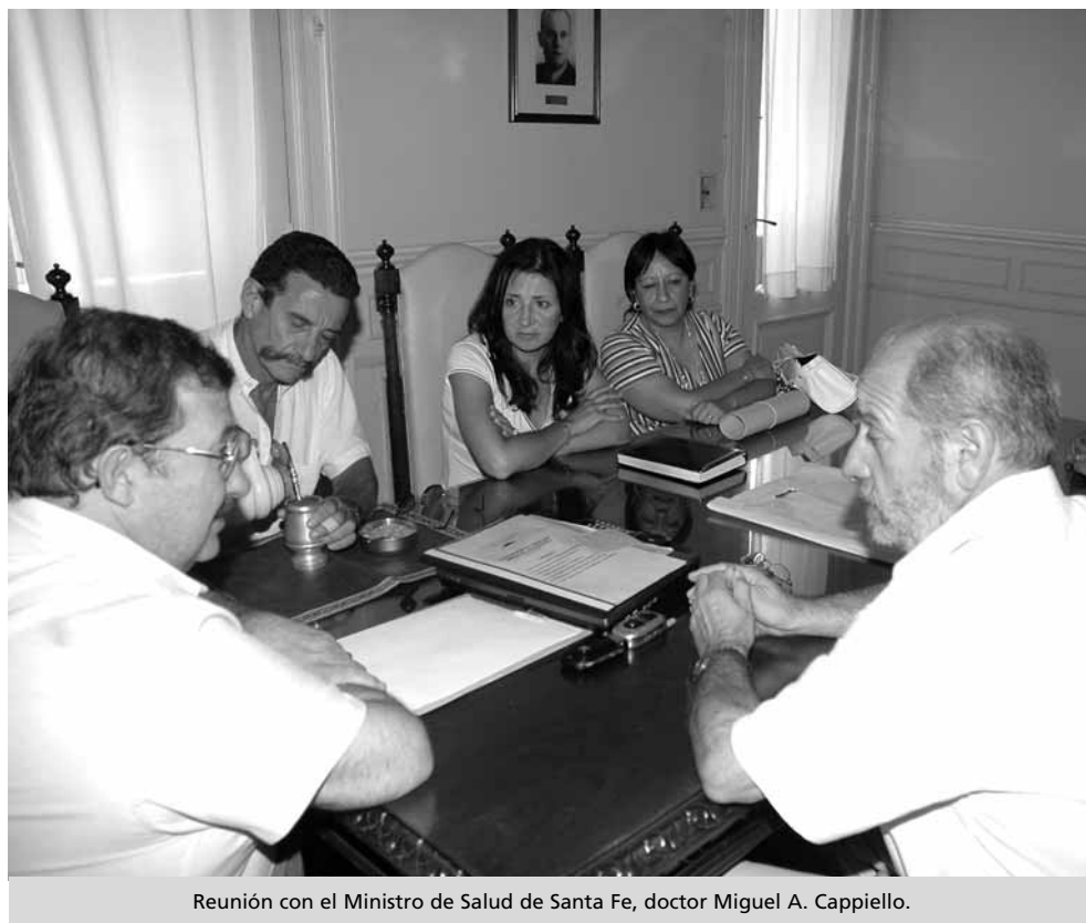
Reunión con el Ministro de Salud de Santa Fe, doctor Miguel A. Capiello.