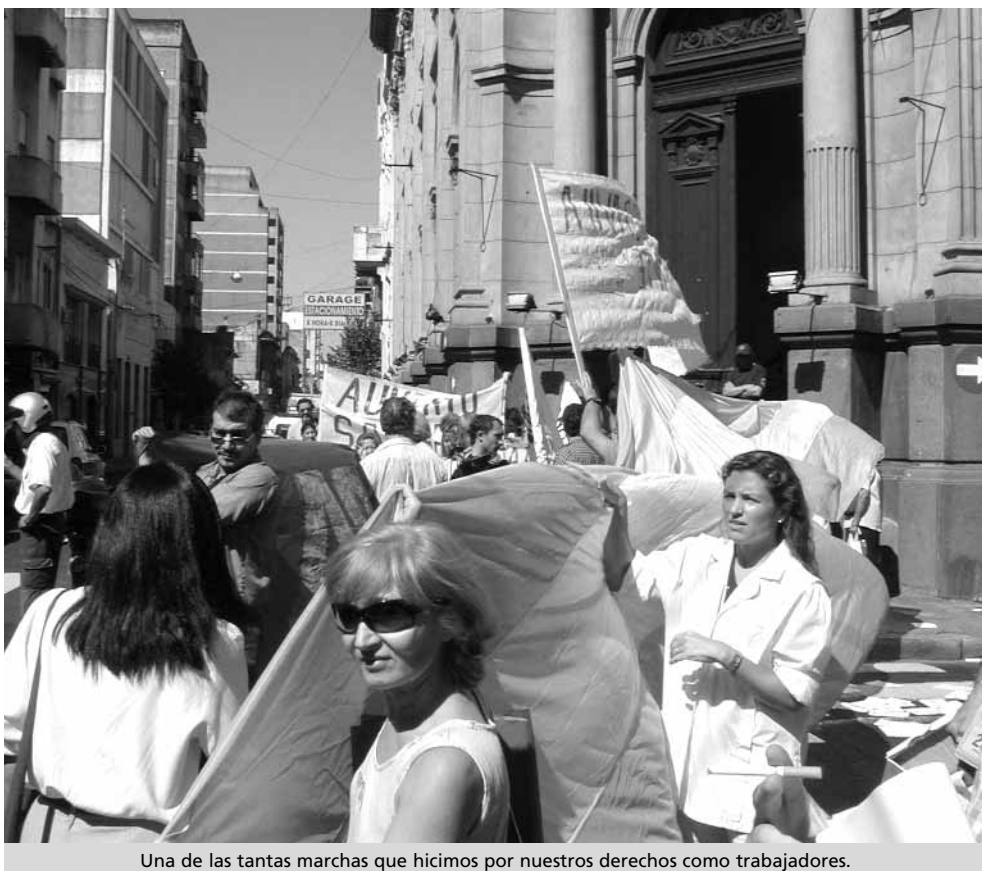
Una de las tantas marchas que hicimos por nuestros derechos como trabajadores.

En el año 2007 con casi la totalidad de los médicos en Planta se logra el blanqueo de los reemplazantes que pasaron a partir de allí a gozar de sus derechos como trabajadores (vacaciones, aguinaldo, etc.).