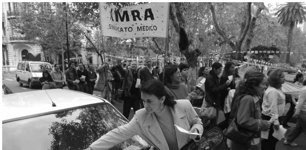
Movilización, una herramienta bastante usada a lo largo de esta década.