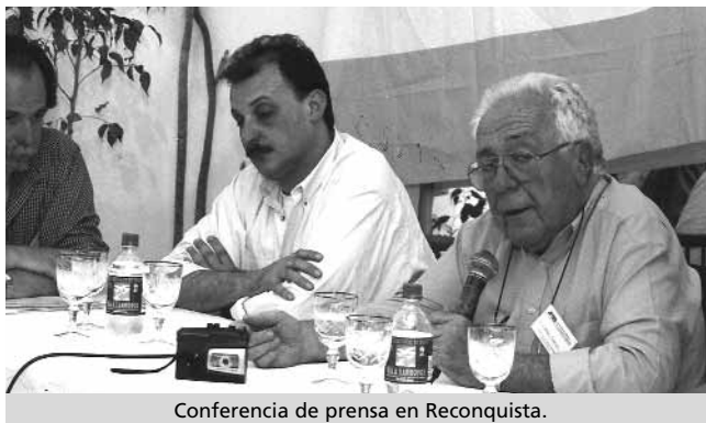
Conferencia de prensa en Reconquista.

Tenemos un objetivo común: la defensa de los legítimos derechos de los médicos y propender a un ejercicio digno de la profesión en beneficio de la salud de la población.