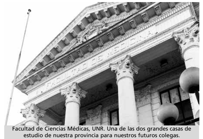
Facultad de Ciencias Médicas, UNR. Una de las dos grandes casas de estudio de nuestra provincia para nuestros futuros colegas.

En realidad creemos que deberíamos tener un lugar en alguna cátedra y ser parte de la currícula para que ustedes conozcan nuestra