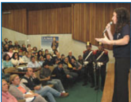
Charla sobre el cruce Los Andes