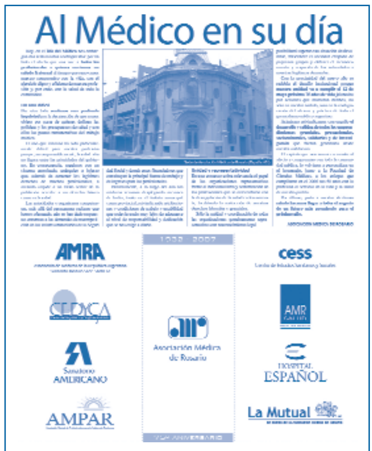
Página institucional publicada en el diario La Capital con motivo del Día del Médico

Asimismo reivindicamos con orgullo el desarrollo y solidez de todos los emprendimientos gremiales, prestacionales, socioculturales, solidarios y de investigación que fueron gene-