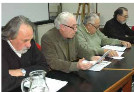
Mesa reflexiva de médicos por el Bicentenario

En la agenda cultural 2010 además de los habituales ciclos de música Galenos y Corcheas , Charlas de Entrecasa , Encuentro Literario y Exposiciones de Artes Plásticas , este año se dio edición a dos revistas literarias Consonante Vocal con trabajos de profesionales del Arte de Curar.