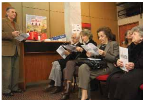
Presentación de la revista Consonante Vocal