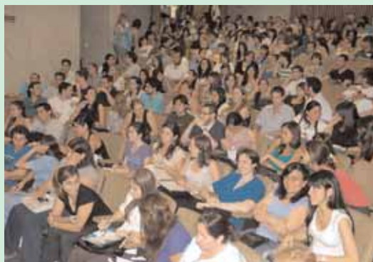
Día de inscripción al curso en Auditorio de AMR

Compartimos la realización del Curso de Pre-residencia y Concurrencia con Colegio de Médicos porque para los graduados las motivaciones principales son la necesidad de formación y el entrenamiento que el curso propone por su intensidad (dos encuentros semanales). Además